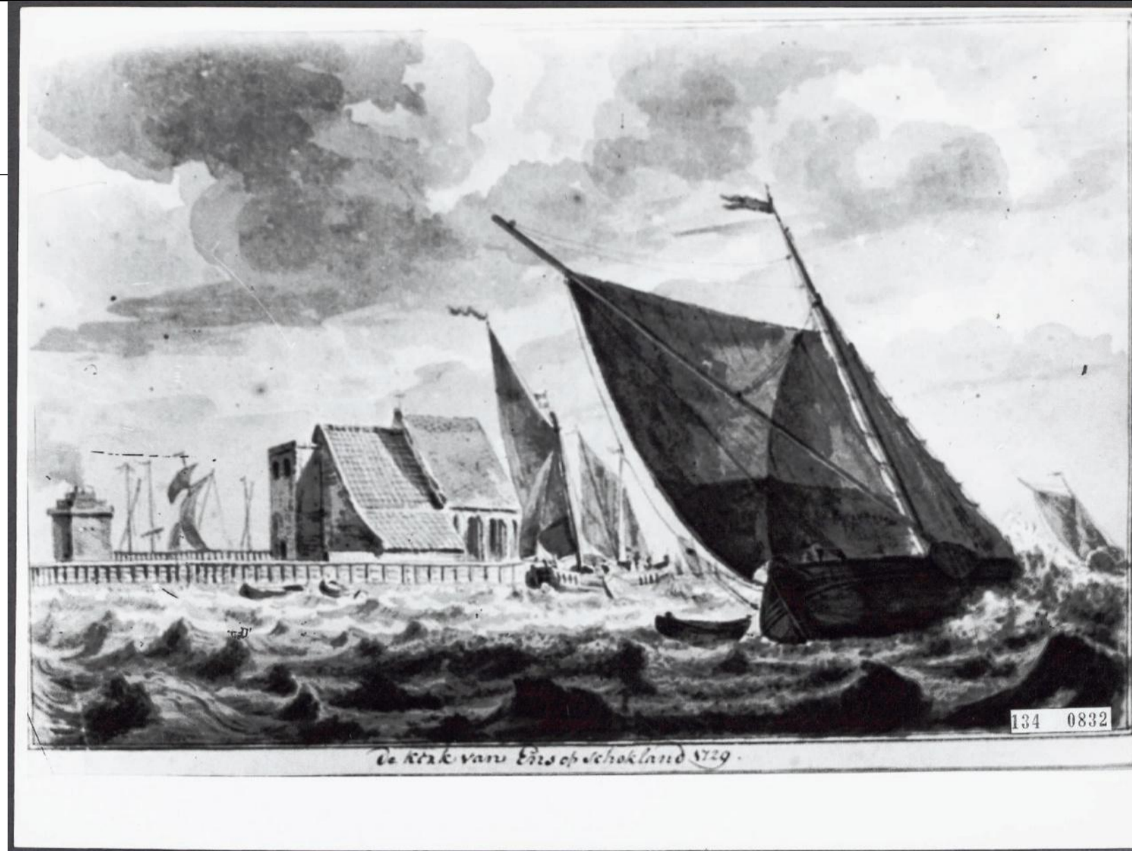
Schokland in 1729

De culturele identificatie vertoont een vergelijkbaar traag tempo. De eerste generatie maalt nog niet om het verleden. De tweede evenmin. Pas de derde en de vierde generatie ontdekt haar Schokkerse existentie. Dat doet ze op eigen kracht, maar ze wordt evenzeer aangestoken door de geromantiseerde aandacht voor