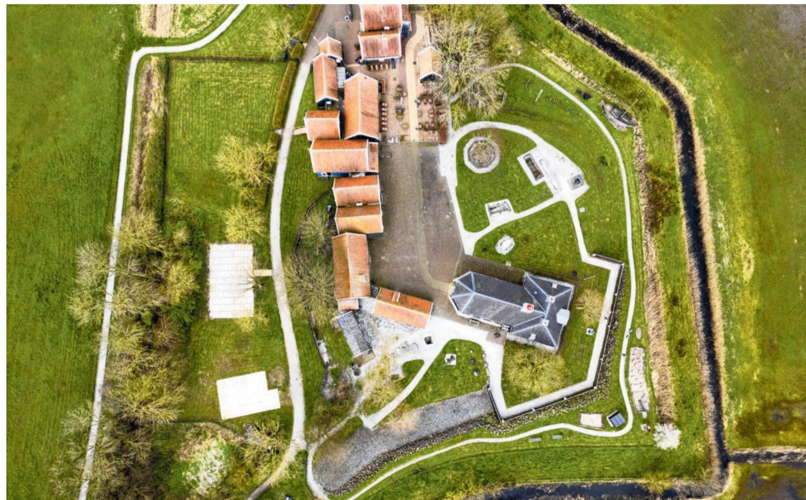
Luchtfoto van het voormalige eiland Schokland in de provincie Flevoland.

de geïsoleerde Zuiderzeecultuur als best bewaarde geheim van het 'echte Holland'. De Schokkers omhelzen elkaar op bijeenkomsten, zingen samen liederen over vissers die thuiskomen, verstrooien as van overledenen op het drooggelegde eiland, en herkennen de Schokker in elkaar. Ook Anna blijft een echte Schokker. Ze is trots als de directeur van het Zuiderzeemuseum haar huisje wil hebben voor de vaste expositie, totdat ze op de dag van de opening ontdekt dat ze er een wit